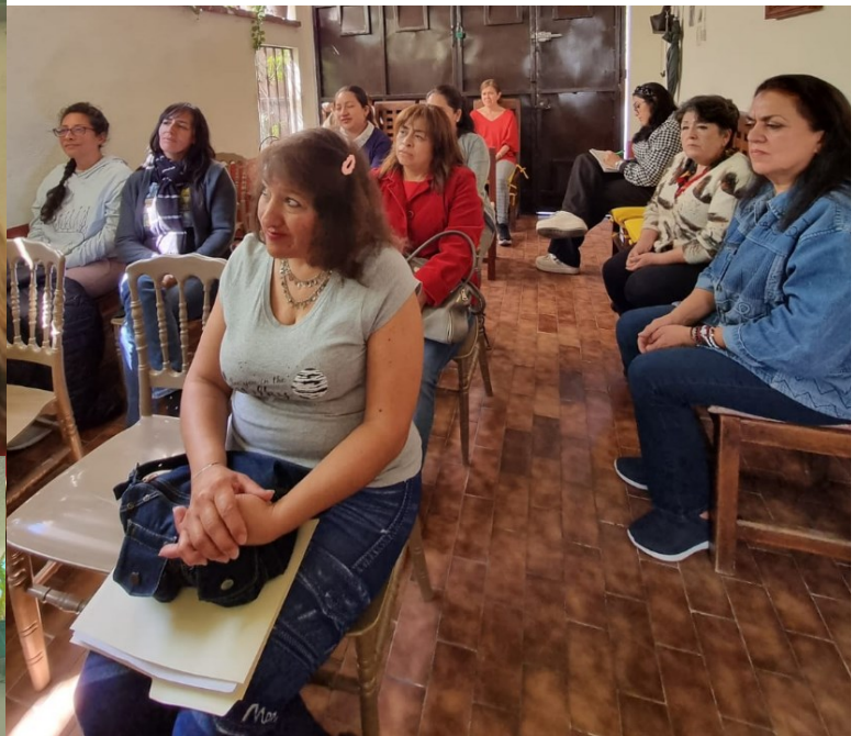
Con singular atención, los presentes escuchan la exposición de temas relacionados a la ciencia espirita, para después resolver su duda con los expertos.

Y es así, como la Central Espirita Mexicana A.C. sale a diferentes puntos de nuestro país, para difundir la ciencia del espíritu, sin importar lugar, tiempo o circunstancias, Siempre a favor del bien por la ciencia.