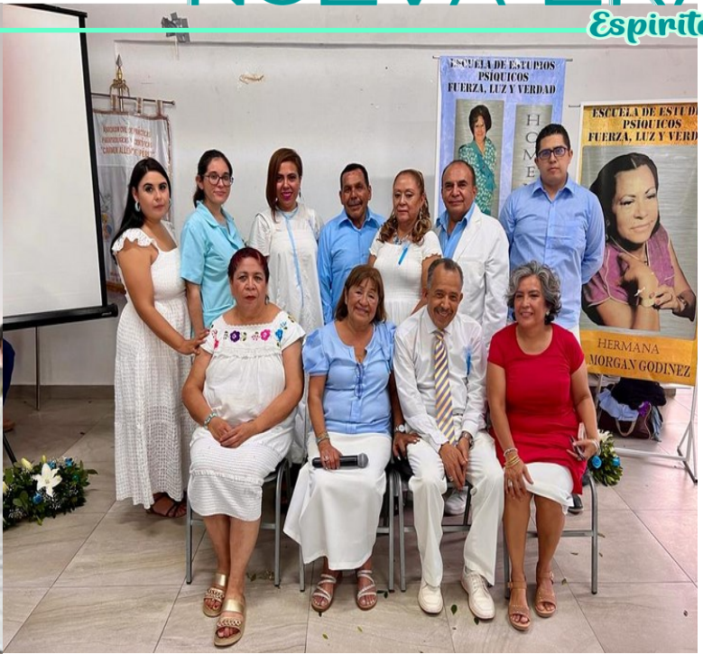
Arriba. Componentes de la Escuela de Estudios Psíquicos Fuerza. Luz y Verdad, en su LXXXIII aniversario.