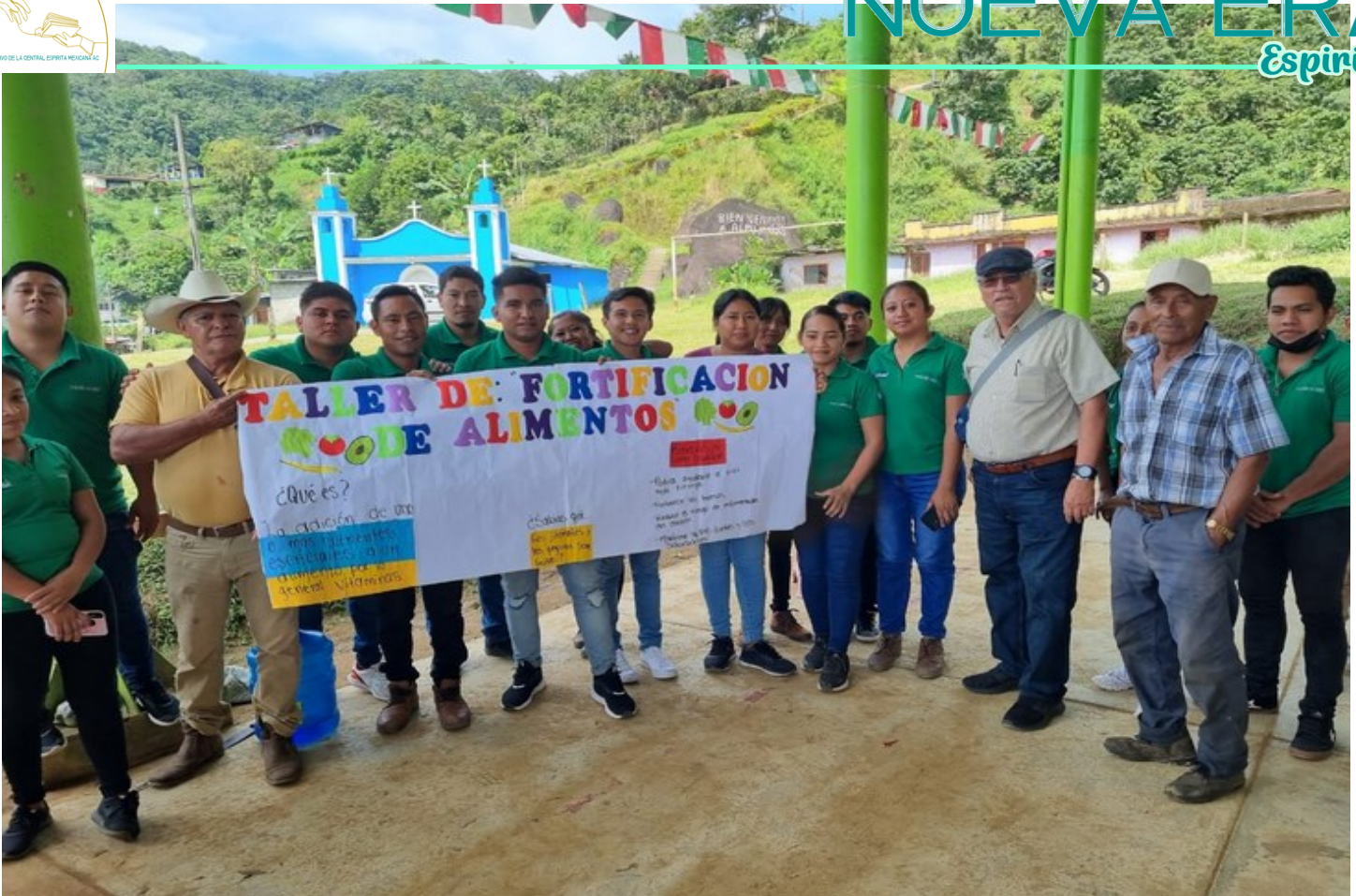
Taller de Fortificación de alimentos, en el Estado de Chiapas cerca de la frontera con Guatemala, México

Gratos recuerdos al poder estar con contacto con nuestros hermanos y compartir el conocimiento, el tiempo y la compañía.