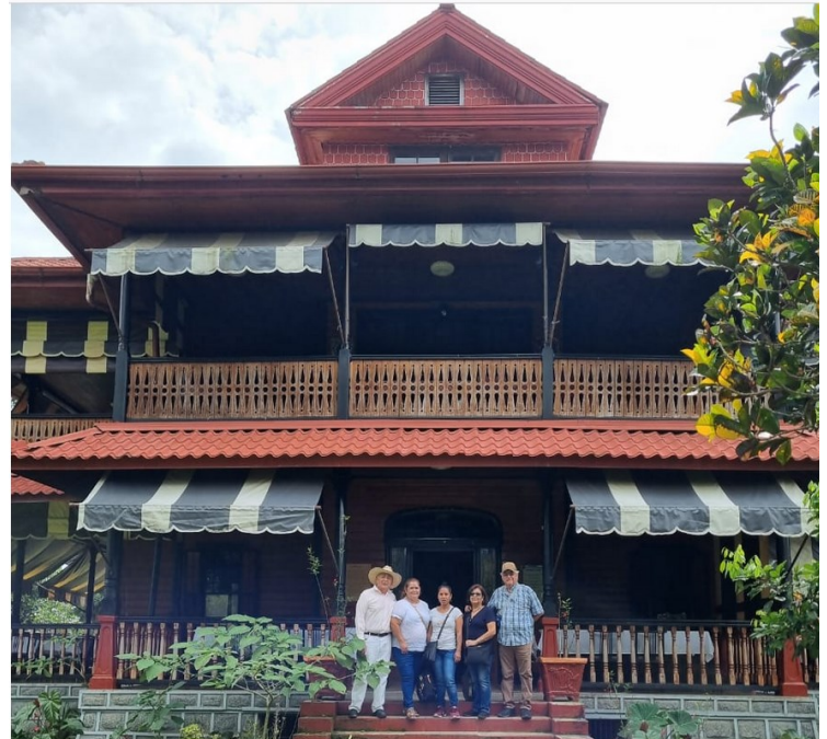
En el Estado de Chiapas, México; dentro de la población Cacahothan, sin importar las distancias.

Y sin importar la distancia, el clima o la adversidad, su trabajo en función de dar a conocer el espiritismo en