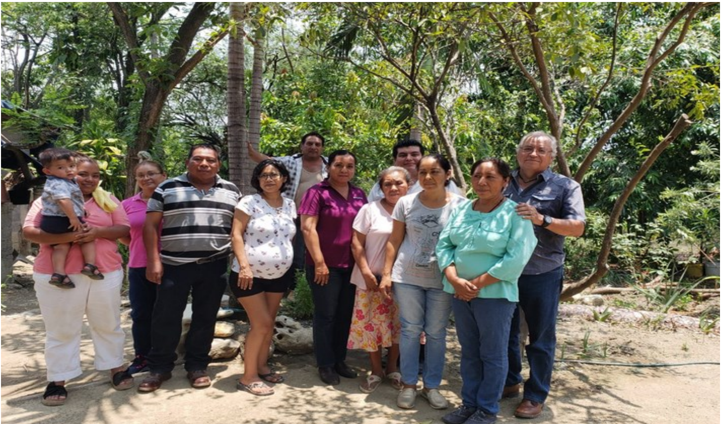
Abajo, al lado de nuestros hermanos de Ciudad Valles, en San Luis Potosí.